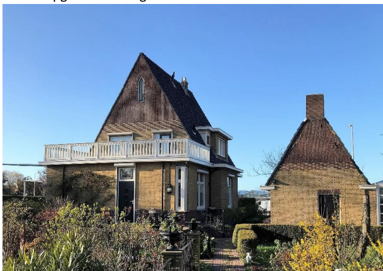
Achterzijde van de woning