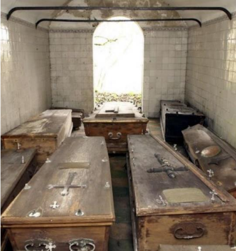
Foto grafkelder met 14 kisten