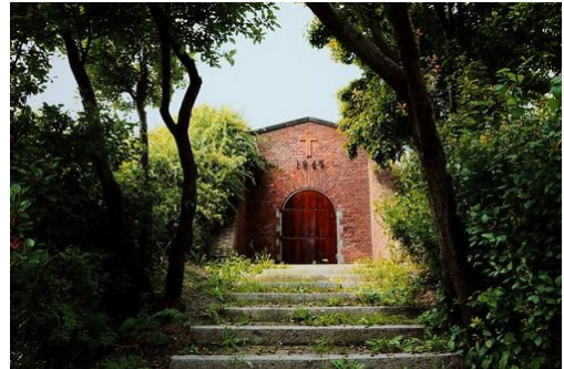
buitenzijde van de grafkelder

Beide buitenplaatsen zijn in het verleden gesloopt. Hier resten alleen nog foto's en schilderijen. Slechts de grafkelder werd met veertien grafkisten, zoals dat uit het gemeentelijk register blijkt, op 21 mei 2002 als Rijksmonument onder de nummer 525142 in het Rijksregister opgenomen.