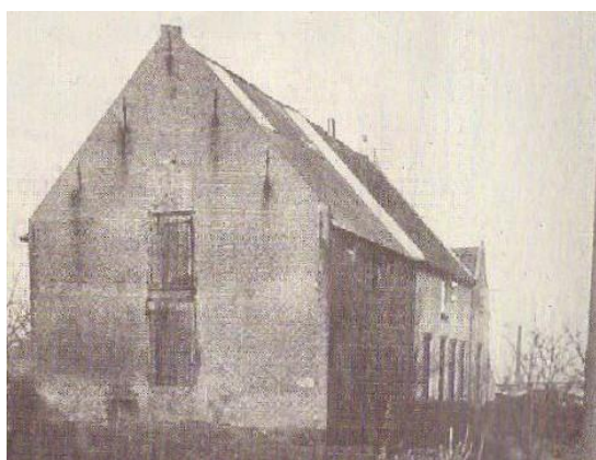
Baakwoning, 1950.

In de buurtschap Baakwoning heeft eind 18 e eeuw voor korte tijd een buitenplaats gestaan met de gelijklopende naam. Het bestond uit een herenhuis, tuinmanswoning en een grote boerderij met zo'n 40 ha landerijen. Een herenhuis op het platteland werd doorgaans door de stedelijke eigenaar gebruikt om de zomermaanden door te brengen.