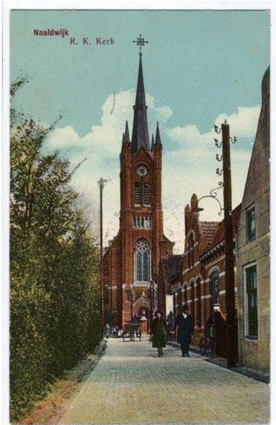
De Adrianus Kerk vanuit de Kleine Woerdlaan gezien