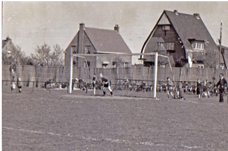
Opname vanaf het Veloterrein naar de Noordweg