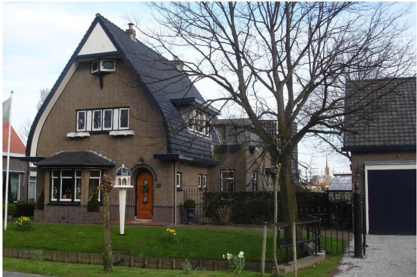
woning met Amsterdamse School stijl elementen