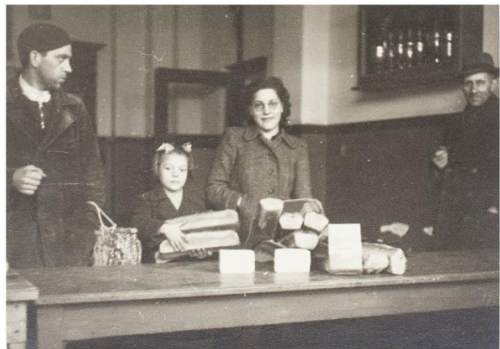
brooddistributie in Wateringen