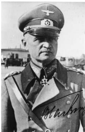
Johannes Blaskowitz (1883-1948)