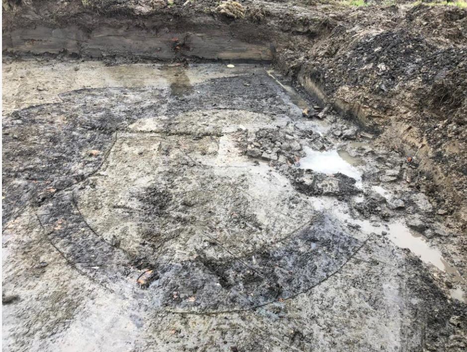
Sporen van het praefurnium

meer kenmerken gevonden die wijzen op een Romeinse Villa, zoals het gebruik van dakpannen en resten van een hypocaust. Dit laatste is een verwarmingssysteem bestaande uit een verhoogde vloer die door middel van hete lucht uit een oven, een praefurnium genoemd, vanaf de onderkant wordt verwarmd.