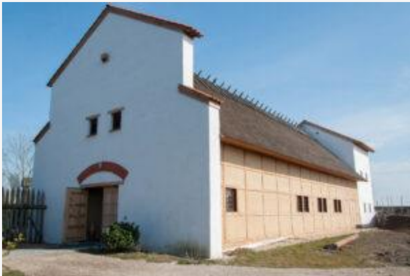
Het stenen gebouw zou eruit kunnen hebben gezien zoals de villa van Rijswijk (reconstructie)

Over de verkaveling van het gebied is tijdens de opgraving ook meer duidelijk geworden. Rondom de kavel van vijftig bij zestig waarbinnen het stenen gebouw heeft gestaan, lag een greppel van zo'n vijf meter breed en plat uitgegraven. Waarschijnlijk is deze vaart gebruikt om bouw materiaal aan te voeren. De tufsteen die gebruikt is voor de fundering komt namelijk niet voor in Nederland. Deze moest in de Eifel worden gewonnen. Steenfragmenten met cement eraan, die in diezelfde vaart zijn gevonden, wijzen erop dat de villa op een later moment is afgebroken en de stenen weer over het water vervoerd zijn om ze op andere plekken te kunnen hergebruiken.