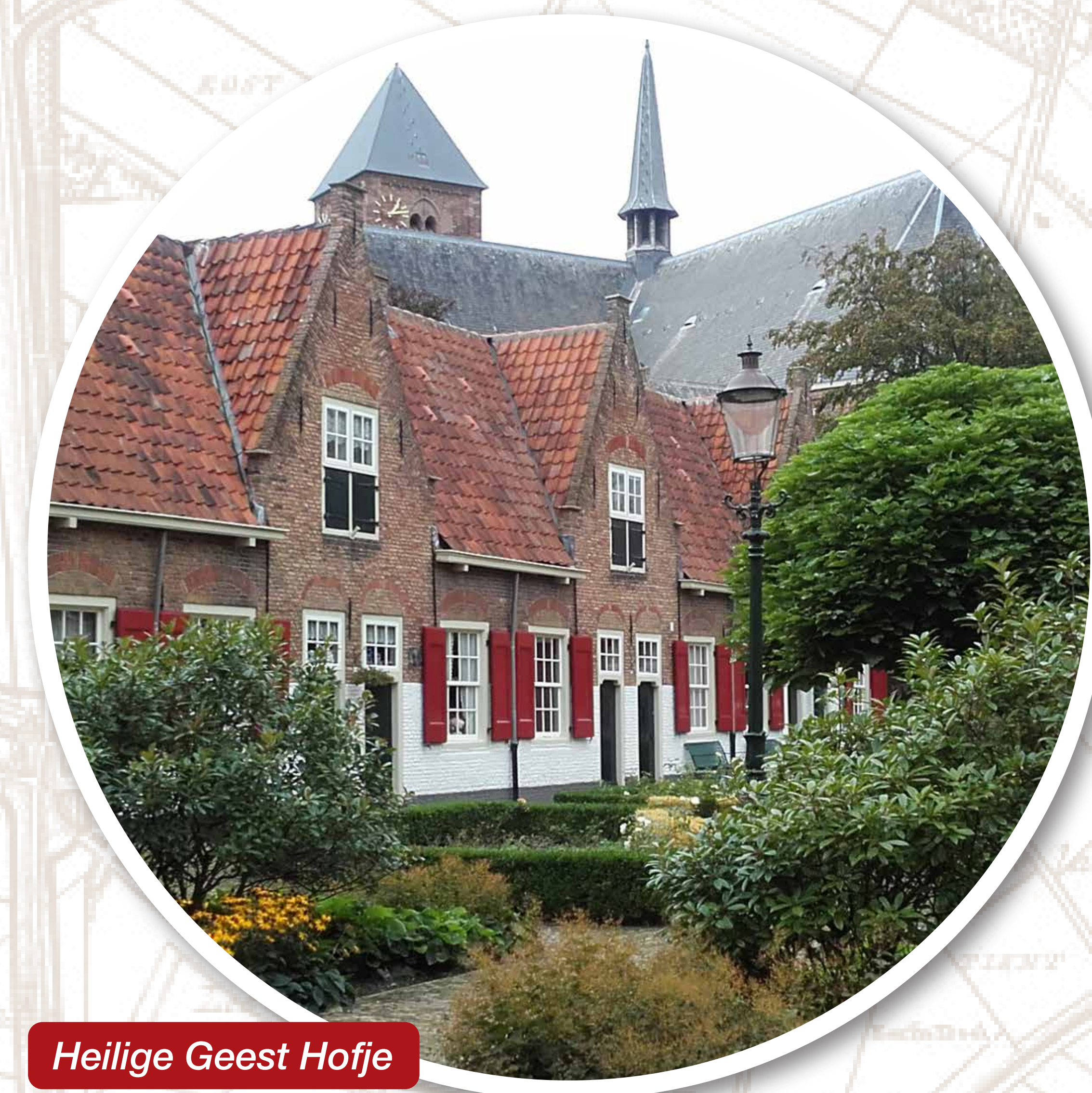
Heilige Geest Hofje