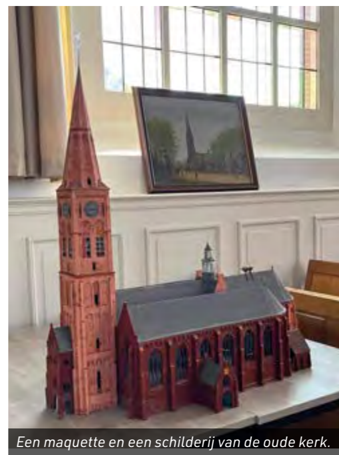
Een maquette en een schilderij van de oude kerk.

De Molen van Maat uit 1908 was zaterdag van 10.00 tot 16.00 uur geopend. Ca. 300 bezoekers, waarvan 180 kinderen, wisten de weg naar de molen te vinden. De hele koren molen kon worden bezichtigd en de omloop (de stelling) worden beklommen. De molenaar demonstreerde hoe diverse granen op ambachtelijke wijze worden verwerkt tot volkorenmeel, bloem en diverse bakmixen. Voor de molen stond van 11.00 tot 15.00 uur een poffertjeskraam, waar de gratis poffertjes gretig aftrek vonden. Veel kinderen genoten samen met hun papa's, mama's,