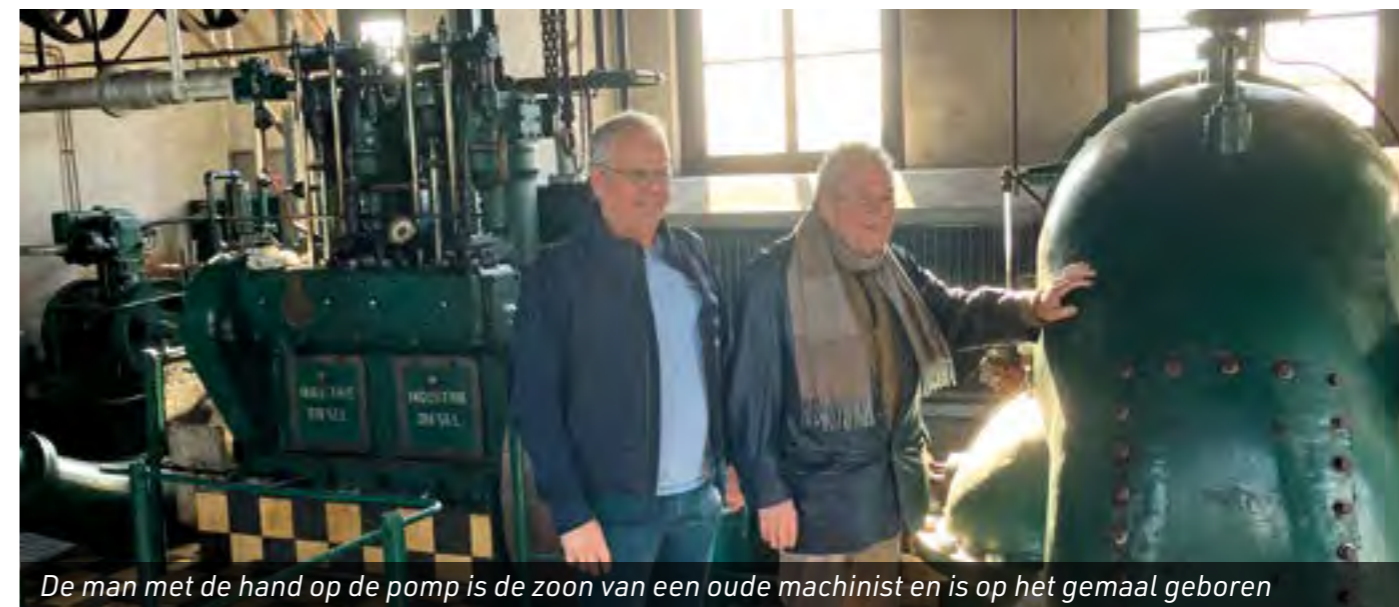
De man met de hand op de pomp is de zoon van een oude machinist en is op het gemaal geboren

aanpak van Hoogheemraadschap Delfland naar voren te kunnen brengen. En elk jaar is er wel iemand die vertelt dat die zóó vaak langs is gefietst en dat die nu blij is dat ie eindelijk een keer binnen kon kijken. Het is vaker gezegd, maar de samenwerking met de boot naar de Zeven Gaten werkt positief op het bezoekersaantal. Het gemaal doet daar zijn voordeel mee.